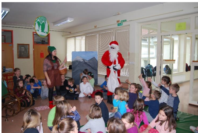
Obisk božička, 23. 12. 2016