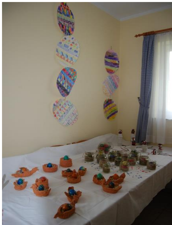
Sodelovanje na razstavi ob veliki noči, 7. 4. 2017