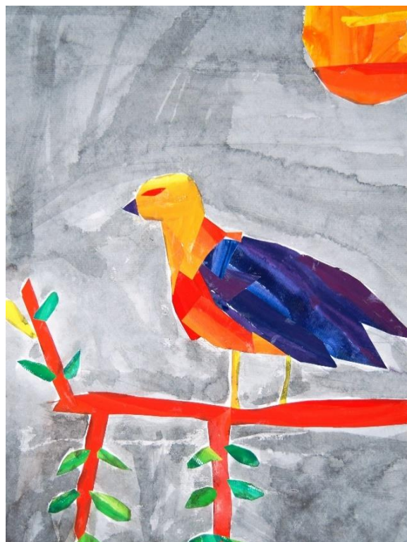
Janez Šmigoc, 5. e