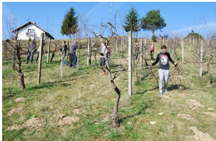
Delo v sadovnjaku, 21. 3. 2017