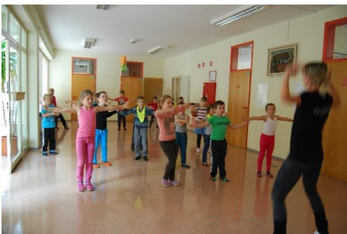
8 krogov odličnosti, 10. 11. 2016