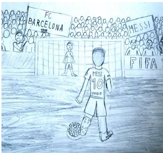
Tijan Potočnik, 6. e