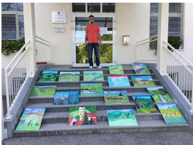
Mala likovna kolonija Haloze, 26. 5. 2017