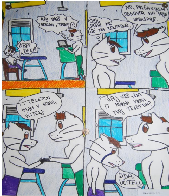
Anja Kozel, 7. e