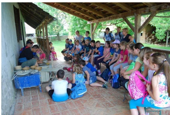
Ekskurzija v Prekmurje, 6. 6. 2017