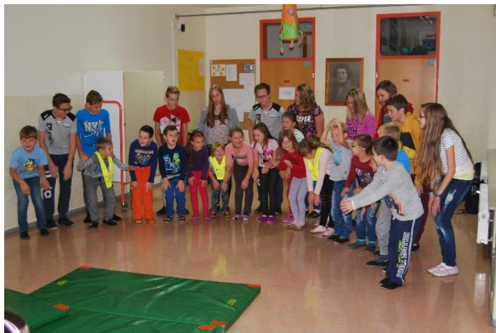
Plesna delavnica, 14. 10. 2016