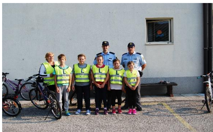
Zlatkov pokal, 15. 9. 2016