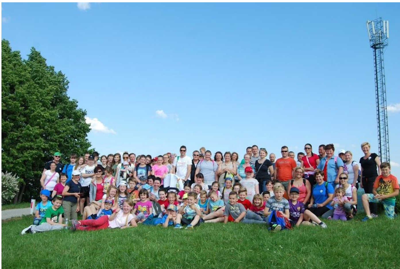
Skupinska fotografija udeležencev pohoda