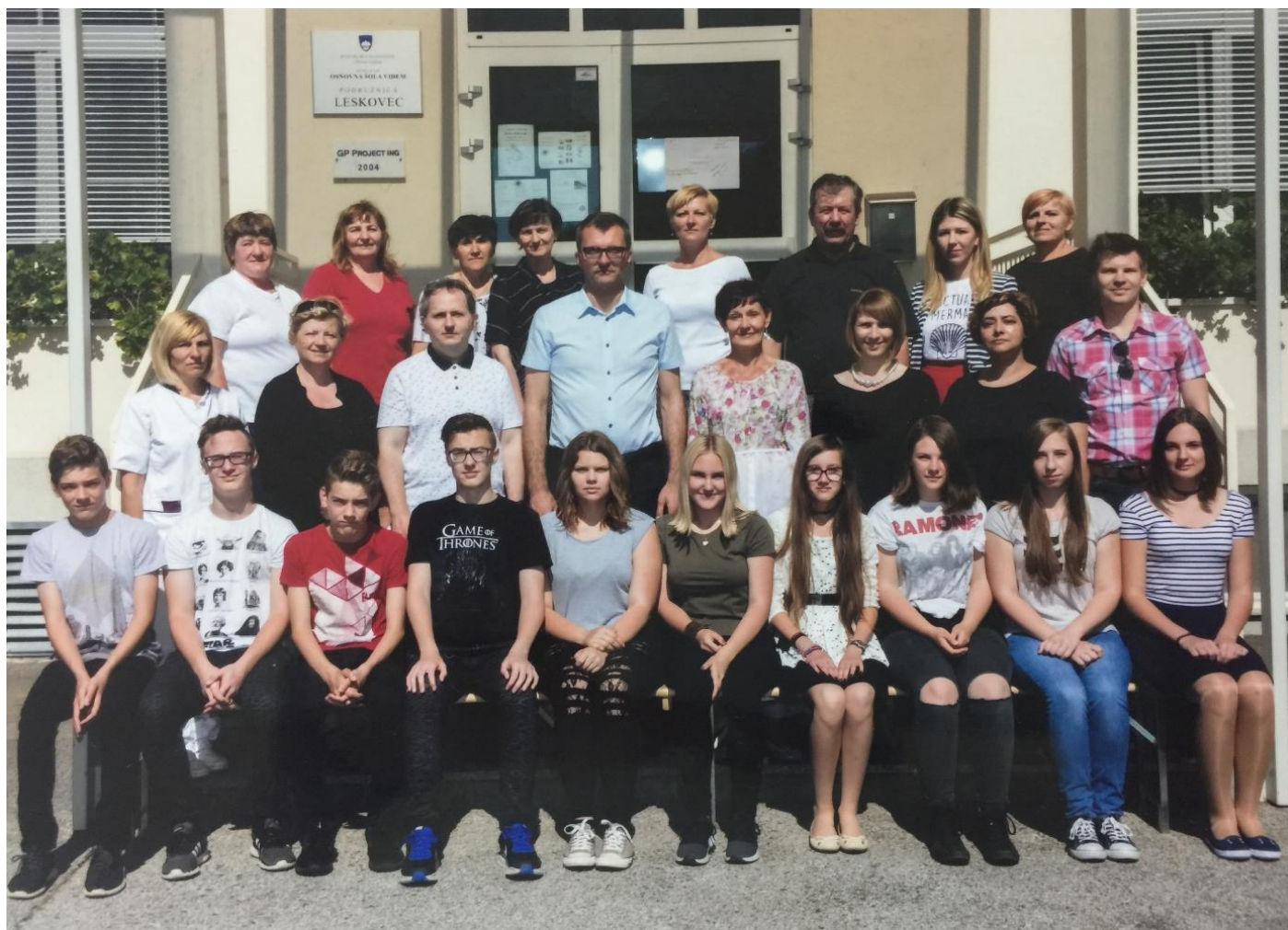
Še ena generacija odhaja na novo pot