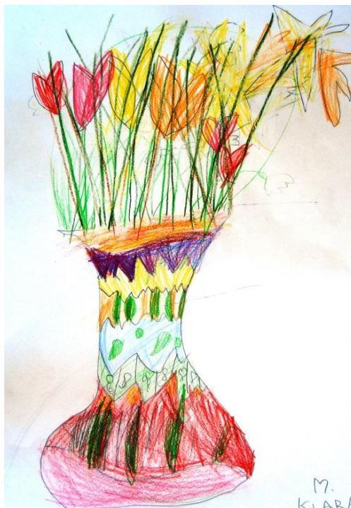
Klara Milkovič, 1. e