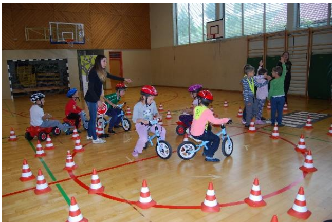
Tehniški dan Varno v prometu, 6. 10. 2016