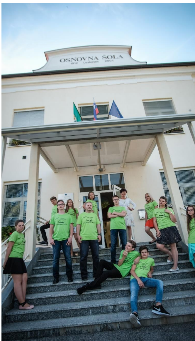
Valeta, 9. 6. 2017