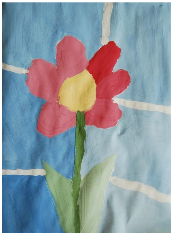
Jana Kozel, 5. e