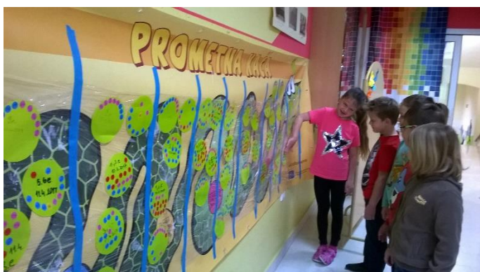
Projekt Prometna kača