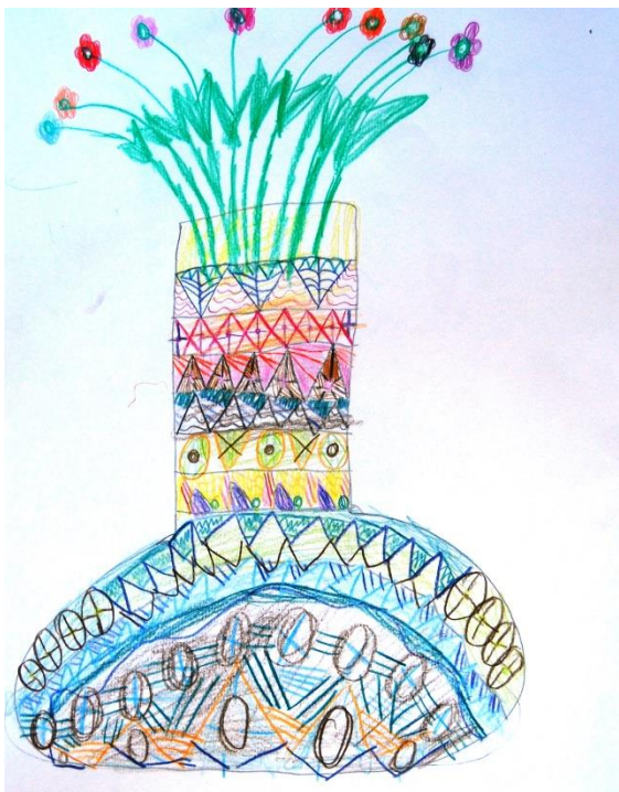
Gal Cafuta, 1. e