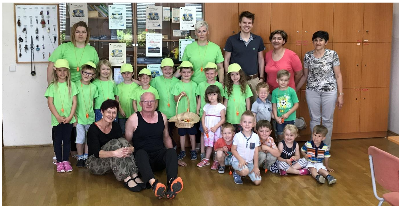
Obisk minimaturantov v zbornici