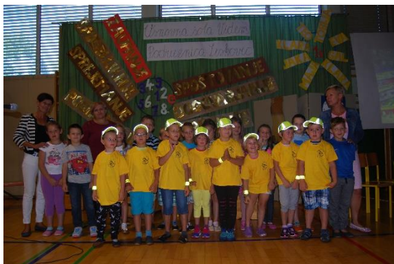
Prvi šolski dan, 1. 9. 2016