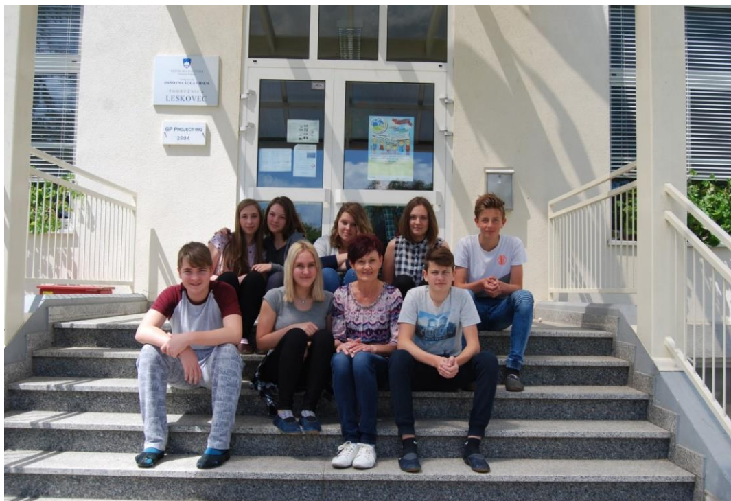
Učenci zgodovinsko-geografskega krožka z mentorico